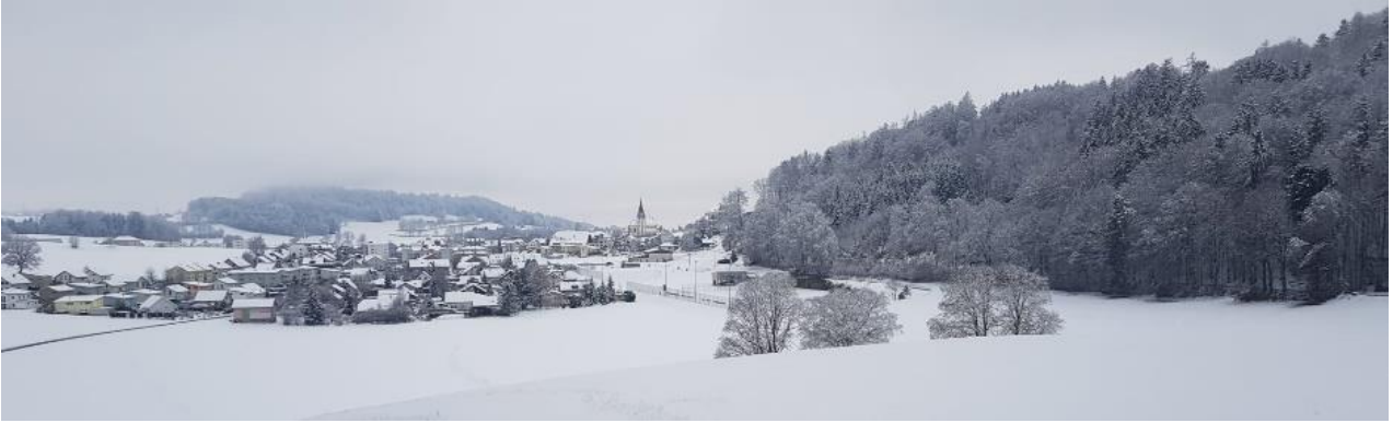
*** Heitenrieder Idylle ***