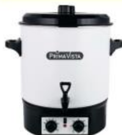
Einkochautomat Prima Vista

Der Sommer ist vorbei! Jetzt gilt es, den Wintervorrat vorzubereiten.