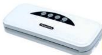
Vakuumiergerät Prima Vista