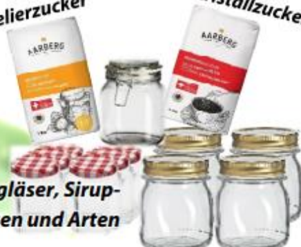
Konfi-Gläser, Einmachgläser, Sirup-Flaschen in jeglichen Grössen und Arten