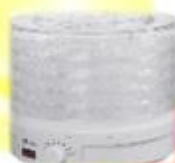
Dörrgerät Prima Vista